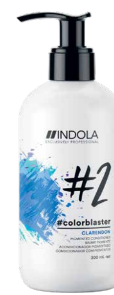
ТОНИРУЮЩИЕ КОНДИЦИОНЕРЫ COLOR BLASTER 9 оттенков